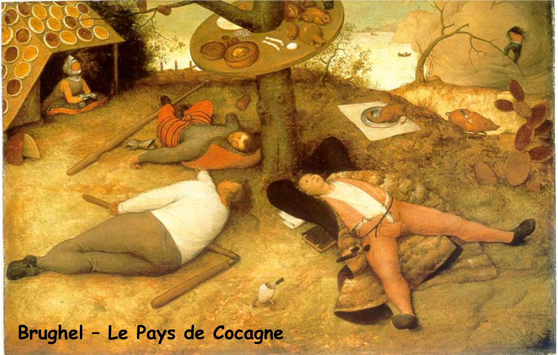
Brughel - Le Pays de Cocagne